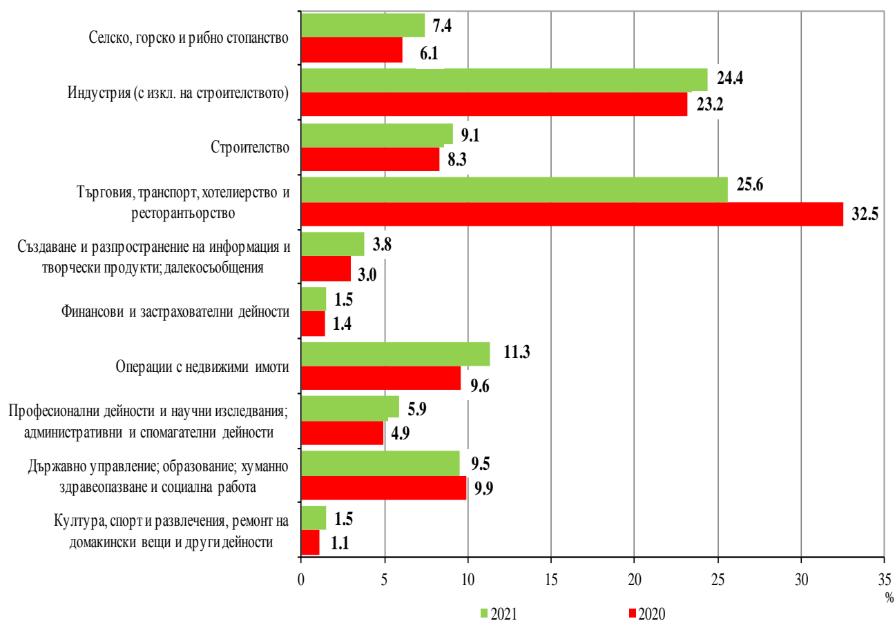
Фиг. 2. Структура на разходите за придобиване на дълготрайни материални активи през 2020 и 2021 г. по икономически дейности

През 2021 г. в структурата на разходите за придобиване на ДМА по икономически дейности се наблюдава нарастване на направените инвестиции в сектора на промишлеността, като относителният им дял се увеличава с 1.2 процентни пункта в сравнение с 2020 г., и спад в сектора на услугите (търговия, ремонт на автомобили и мотоциклети, транспорт, складиране и пощи, хотелиерство и ресторантьорство) с 6.9 процентни пункта.