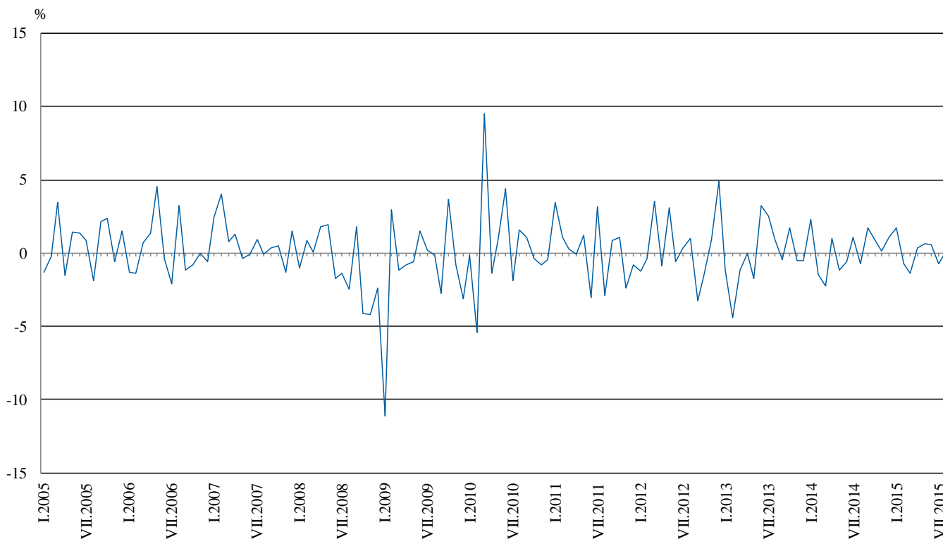
Фиг. 2. Изменение на индекса на промишленото производство спрямо предходния месец (Сезонно изгладени)

По-значителен ръст в преработващата промишленост се наблюдава при: производството на превозни средства, без автомобили - с 16.7%, производството на метални изделия, без машини и оборудване - с 6.3%, производството на дървен материал и изделия от него, без мебели - с 5.9%, производството на тютюневи изделия - с 5.2%. Спад е регистриран при: производството на мебели - с 5.5%, ремонта и инсталирането на машини и оборудване - с 4.8%, производството на автомобили, ремаркета и полуремаркета - с 4.1%, производството на облекло - с 3.5%.