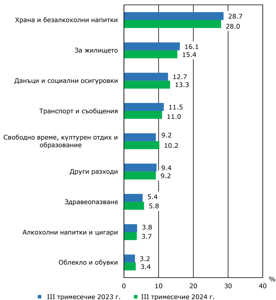
Фиг. 2. Структура на общия разход на домакинство през третото тримесечие на 2023 и 2024 година

В структурата на общия разход с най-голям относителен дял са разходите за храна и безалкохолни напитки (28.0%), следвани от разходите за жилище (15.4%), за данъци и социални осигуровки (13.3%) и за транспорт и съобщения (11.0%).