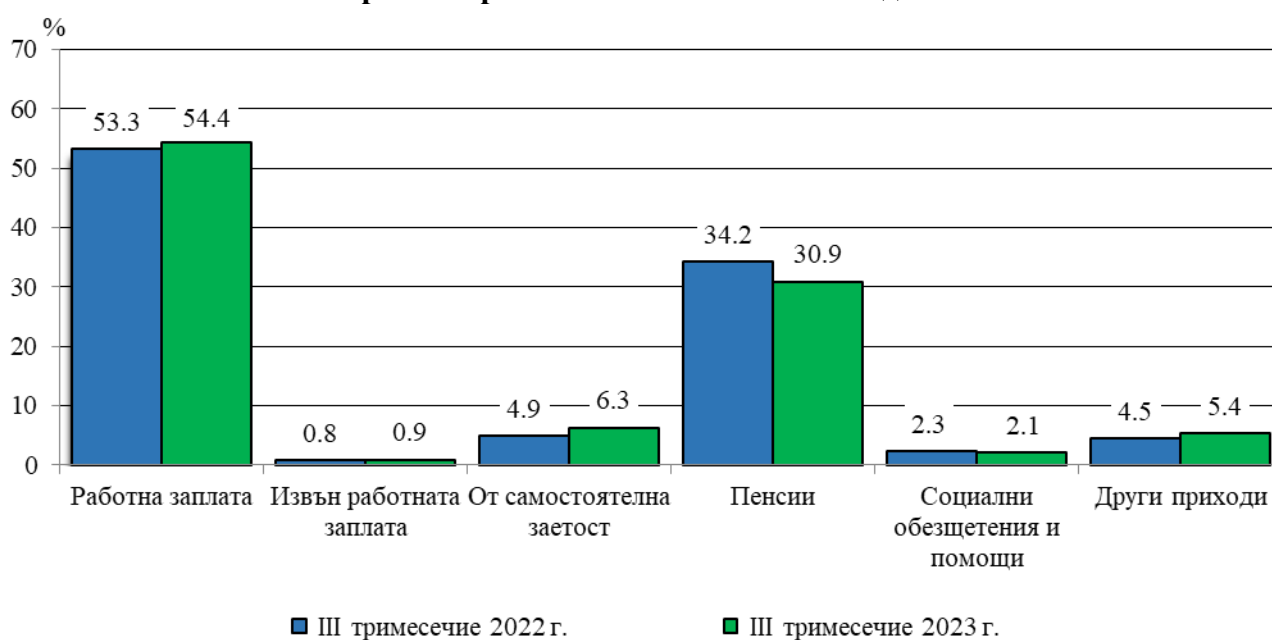
Фиг. 1. Структура на общия доход на домакинство през третото тримесечие на 2022 и 2023 година

В номинално изражение през третото тримесечие на 2023 г. в сравнение със същото тримесечие на 2022 г. доходите средно на лице от домакинство по източници на доход се променят, както следва: