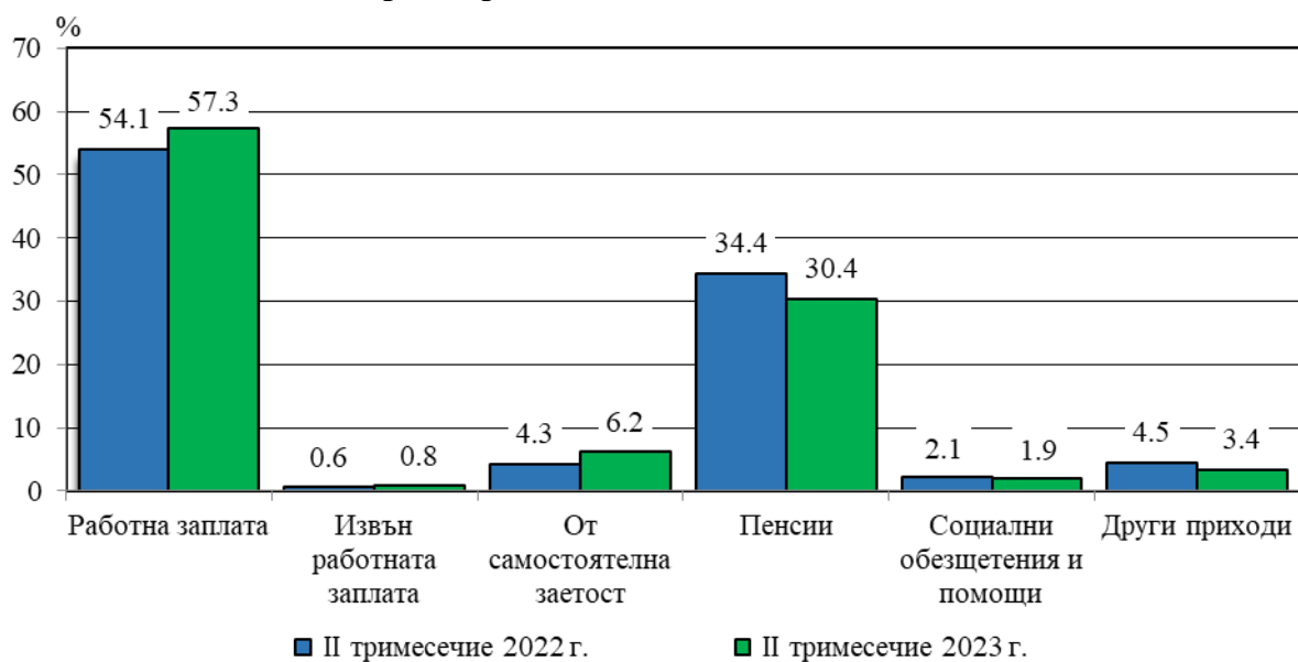
Фиг. 1. Структура на общия доход на домакинство през второто тримесечие на 2022 и 2023 година

В номинално изражение през второто тримесечие на 2023 г. в сравнение със същото тримесечие на 2022 г. доходите средно на лице от домакинство по източници на доход се променят, както следва: