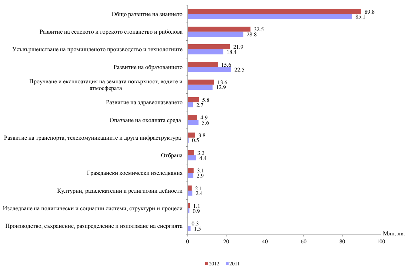
Фиг. 3. Бюджетни разходи за НИРД по социално-икономически цели

През 2012 г. в сравнение с 2011 г. се наблюдава увеличение на бюджетните средства за НИРД, свързани с развитието на транспорта, телекомуникациите и друга инфраструктура и с развитието на здравеопазването. Намаление се регистрира в социално-икономическите цели „Производство, съхранение, разпределение и използване на енергията“ и „Развитие на образованието“.