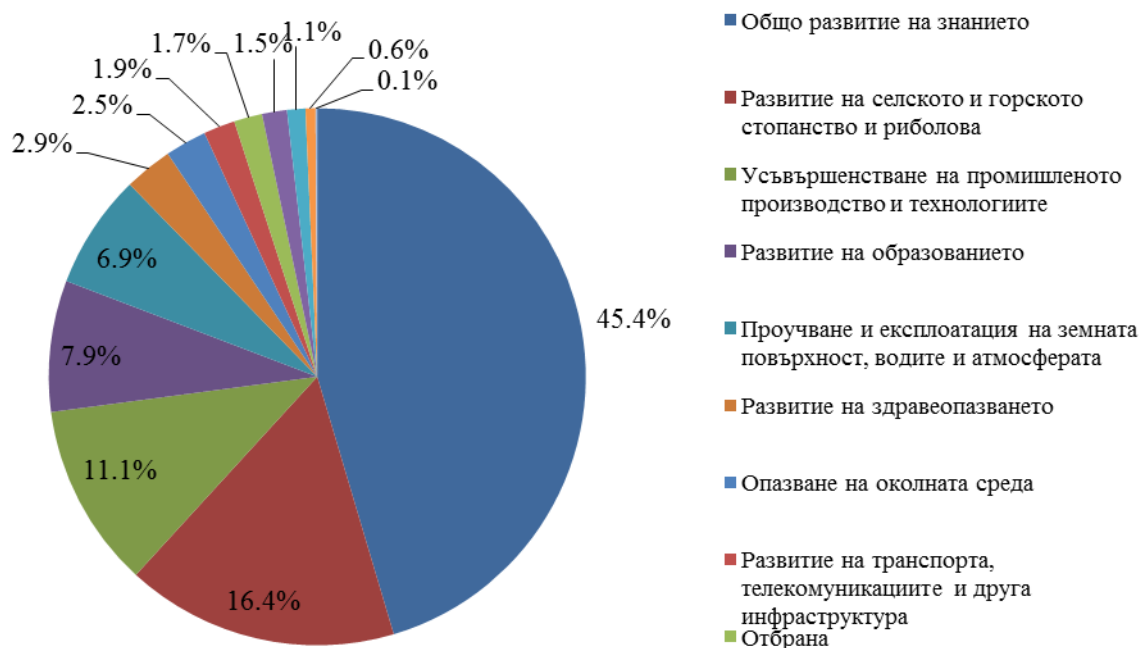
Фиг. 2. Структура на бюджетните разходи за НИРД по социално-икономически цели през 2012 година

Втората най-подкрепяна от държавата цел на научните изследвания през 2012 г. е „Развитие на селското и горското стопанство и риболова” (16.4%, или 32.5 млн. лв.), следвана от „Усъвършенстване на промишленото производство и технологиите“ (11.1%, или 21.9 млн. лв.) и „Развитие на образованието“ с дял от 7.9%, или 15.6 млн. лева.