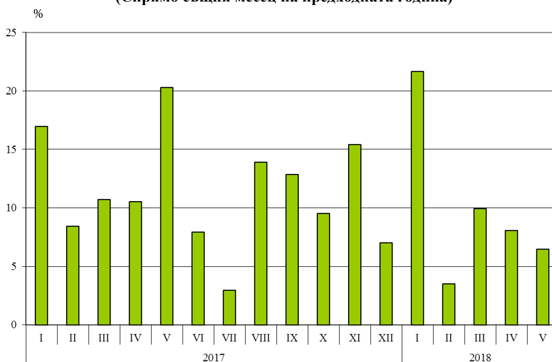
Фиг. 2. Номинално изменение в стойностния обем 1 на вноса на България от ЕС през периода 2017 - 2018 година (Спрямо същия месец на предходната година)

При вноса от ЕС, разпределен според Стандартната външотърговска класификация , през периода януари - май 2018 г. в сравнение със същия период на 2017 г. най-голямо процентно увеличение е отчетено в сектор „Необработени (сурови) материали, негодни за консумация (изкл. горивата)“ (31.2%), а най-голямо намаление се наблюдава в сектор „Мазнини, масла и восъци от животински и растителен произход“ (15.8%).