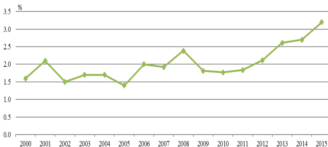
Фиг. 3. Дял на екоразходите от БВП

Разходите за околната среда включват два компонента: разходи за поддържане и разходи за придобиване на дълготрайни материални активи. През 2015 г. инвестициите