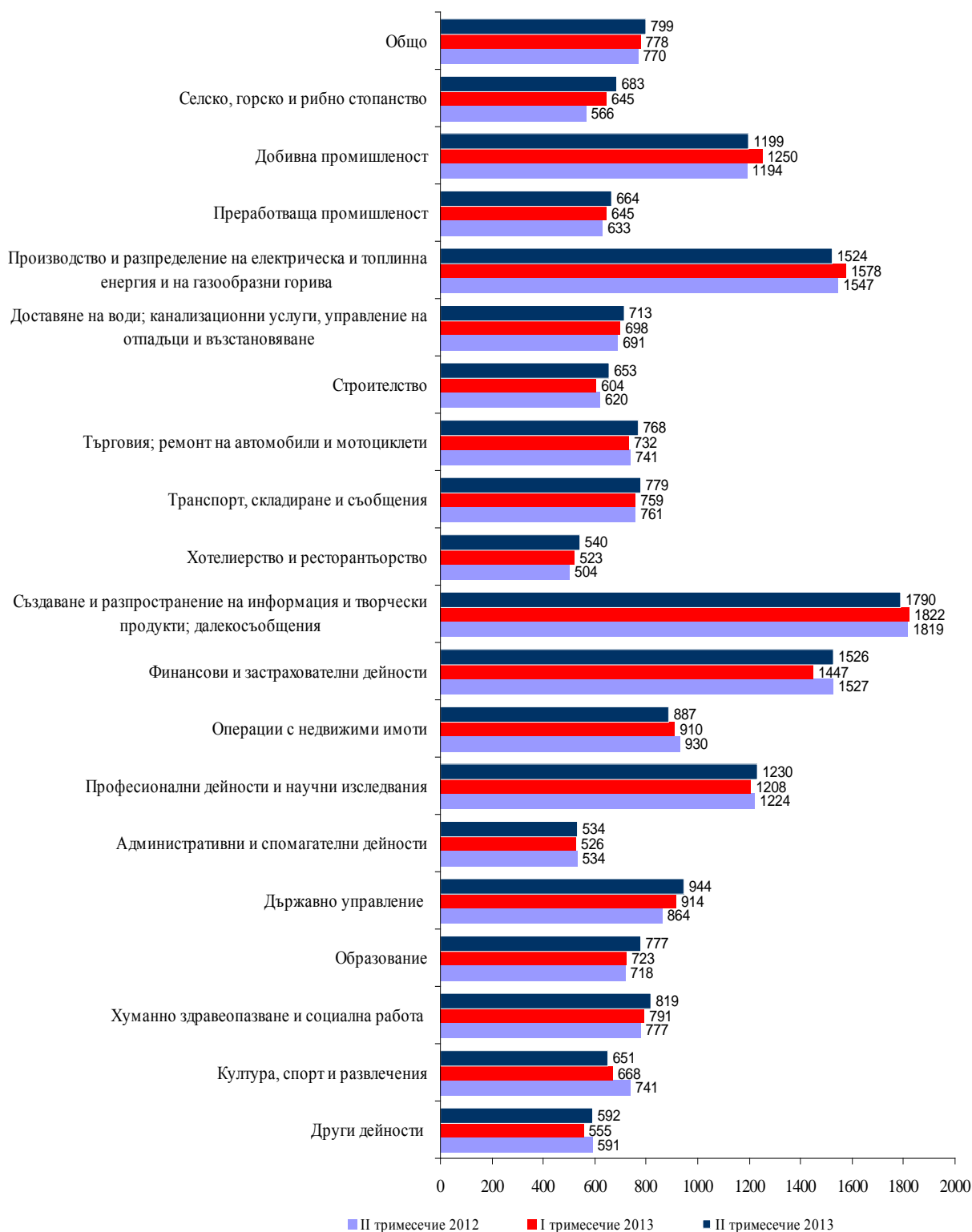
Фиг. 2. Средна месечна работна заплата по икономически дейности (левове)

През второто тримесечие на 2013 г. средната месечна работна заплата се увеличава спрямо първото тримесечие на 2013 г. с 2.7% до 799 лева. Икономическите дейности, в които е регистрирано най-голямо увеличение на средната месечна работна заплата, са „Строителство” - с 8.1%, и „Образование” - със 7.5%.