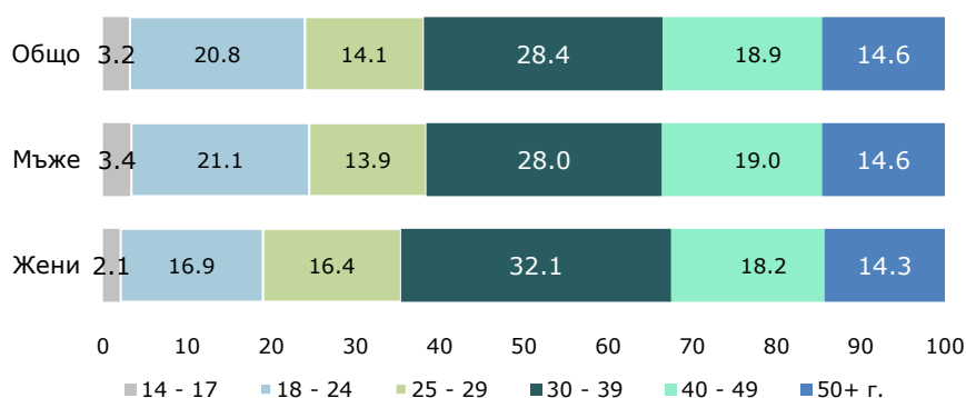
Фиг. 2. Структура на осъдените лица през 2023 г. по пол и възрастови групи

Коефициентът на криминална активност 1 е 411 на 100 000 души от наказателноотговорното население (виж табл. 1). За мъжете стойността му е 794 на 100 000 души, а за жените - 64 на 100 000 души от съответното население. Коефициентът на криминална активност за непълнолетните е 290 на 100 000 от населението в тази възрастова група.