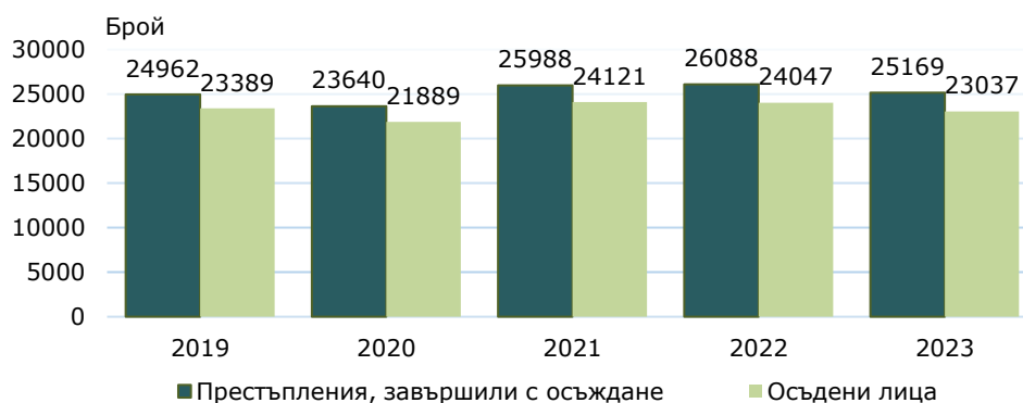
Фиг. 1. Престъпления, завършили с осъждане, и осъдени лица през периода 2019 - 2023 година

Осъдените мъже са 21 167, или 91.9%, а жените - 1 870 (8.1%). Както сред мъжете, така и сред жените, най-голям е дялът на осъдените във възрастовата група