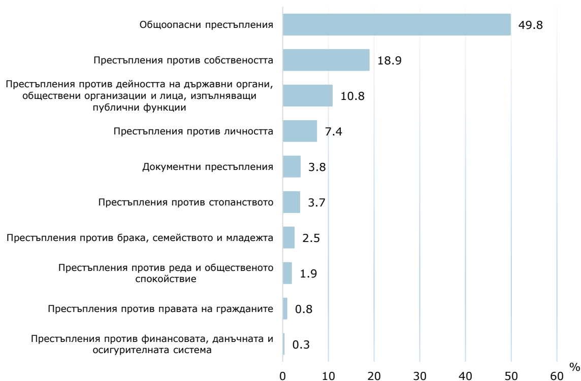
Фиг. 3. Структура на престъпленията, завършили с осъждане през 2023 г. по глави от НК

Почти половината от осъдените са наказани за извършването на общопасни престъпления - 11 022, или 47.8% (виж фиг. 4). На второ място в структурата са осъдените за престъпления против собствеността - 5 069 лица (22.0%).