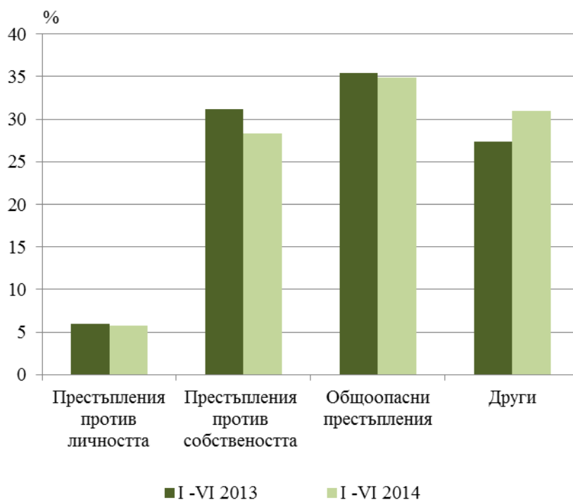
Фиг. 1. Структура на престъпленията, завършили с осъждане, по глави от Наказателния кодекс през първото шестмесечие на 2013 и 2014 година