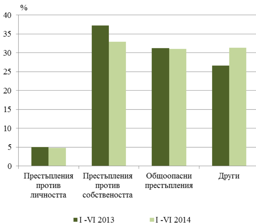
Фиг. 2. Структура на осъдените лица по глави от Наказателния кодекс през първото шестмесечие на 2013 и 2014 година