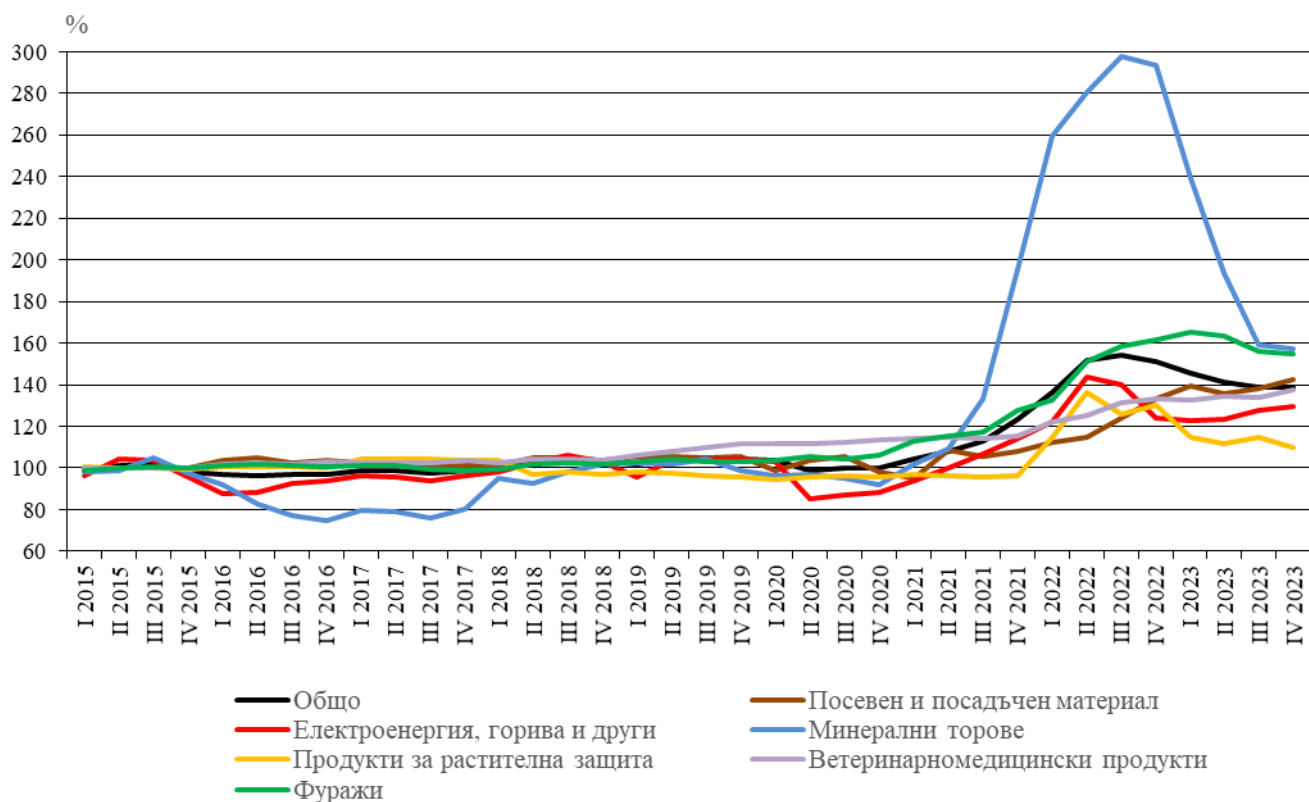
Фиг. 2. Индекси на цените на продуктите и услугите за текущо потребление в селското стопанство по тримесечия (2015 = 100)