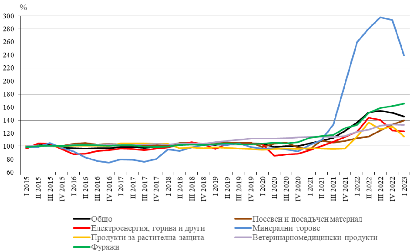
Фиг. 2. Индекси на цените на продуктите и услугите за текущо потребление в селското стопанство по тримесечия (2015 = 100)