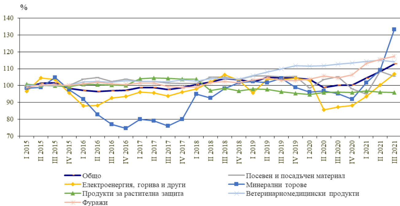
Фиг. 2. Индекси на цените на продуктите и услугите за текущо потребление в селското стопанство по тримесечия (2015 = 100)