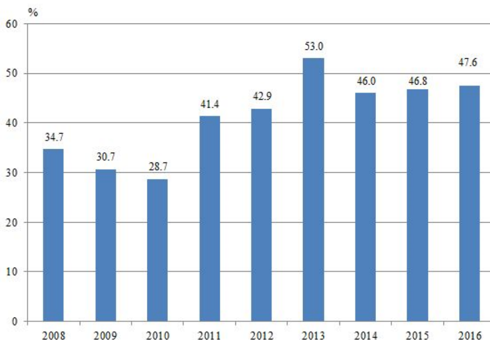
Фиг. 1. Относителен дял на дохода от работна заплата в общия доход на домакинствата в област Търговище

Основен източник на доход е работната заплата, която през 2016 г. формира 47.6% от общия доход на домакинствата в област Търговище – с 0.8 процентни пункта по-малко в сравнение с 2015 година (фиг. 1). За страната процентът е 54.3 – с 0.7 процентни пункта по-малко спрямо 2015 година.