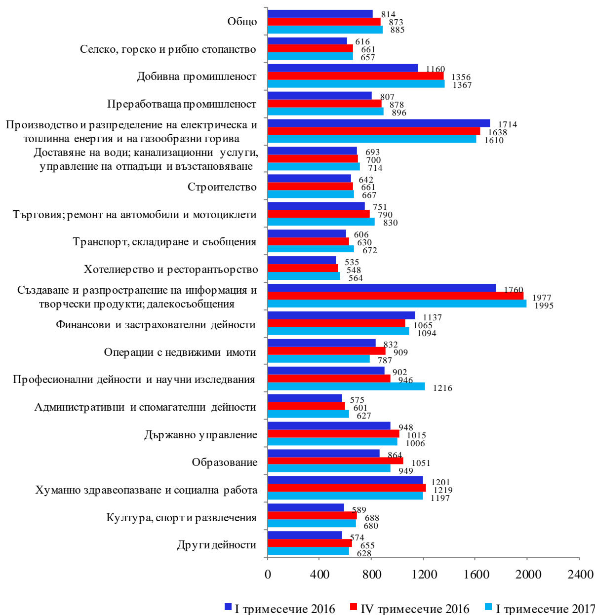
Фиг. 2. Средна брутна месечна работна заплата по икономически дейности – левове

Средната брутна месечна работна заплата в област Пловдив за януари 2016 г. е 870 лв., за февруари - 872 лв. и за март - 915 лева. През първото тримесечие на 2017 г. средната месечна работна заплата нараства спрямо четвъртото тримесечие на 2016 г. с 1.4%, като достига 885 лева. Намаление на средната месечна работна заплата е регистрирано в дейностите „Операции с недвижими имоти“ - с 13.4%, „Образование“ - с 9.7% и „Други дейности“ - с 4.1%. Икономическите дейности, в които е регистрирано най-голямо увеличение на средната месечна заплата, са „Професионални дейности и научни изследвания“ - с 28.5%, „Транспорт, складиране и пощи“ - с 6.7% и „Търговия; ремонт на автомобили и мотоциклети“ - с 5.1%.