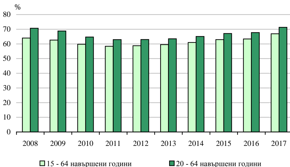
Фиг. 1. Коефициенти на заетост по възрастови групи

• Коефициентът на заетост за възрастовата група 55 - 64 навършени години е 58.2%. В сравнение с 2016 г. той отбелязва нарастване с 3.7 процентни пункта - с 4.2 процентни пункта при мъжете и с 3.3 пункта при жените.