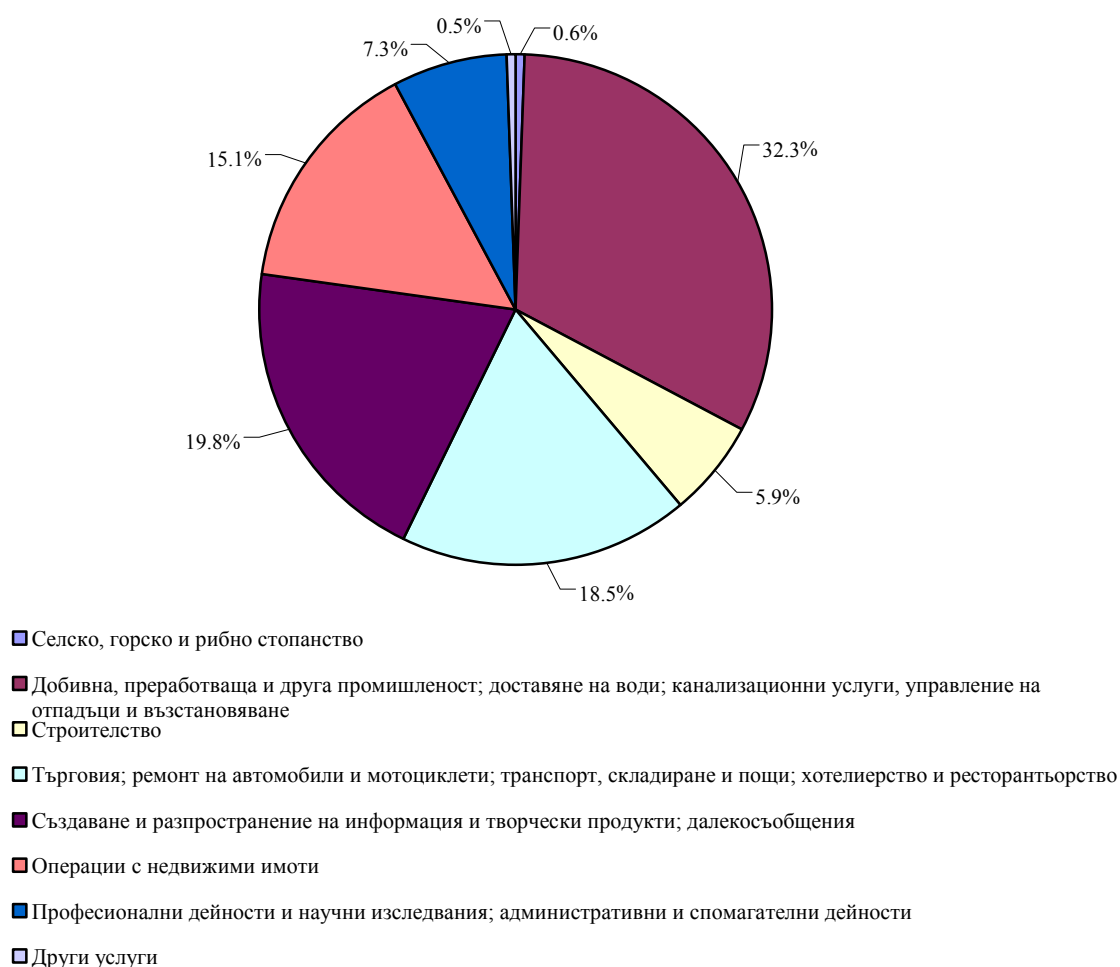
Структура чуждестранните преки инвестиции в предприятията от нефинансовия сектор по икономически дейности към 31.12.2008 година

По предварителни данни чуждестранните преки инвестиции с натрупване към 31.12.2008 г. в нефинансовия сектор възлизат на 19 204 млн. евро. От общите чуждестранни преки инвестиции в нефинансовите предприятия с най-голям относителен дял са „Добивна, преработваща и друга промишленост; доставяне на води; канализационни услуги; управление на отпадъци и възстановяване” - 32.3%, „Създаване и разпространение на информация и творчески продукти; далекосъобщения” - 19.8% и „Търговия, ремонт на автомобили и мотоциклети; транспорт, складиране и пощи; хотелиерство и ресторантьорство” - 18.5%.