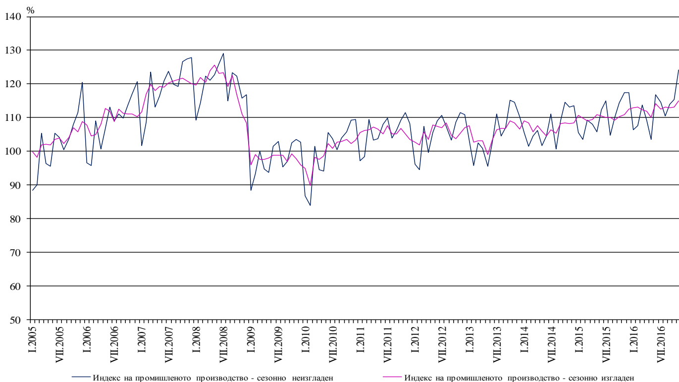
Фиг. 1. Индекси на промишленото производство (2010 = 100)

През ноември 2016 г. при календарно изгладения индекс 4 на промишленото производство е регистриран ръст от 4.3% спрямо съответния месец на 2015 година.