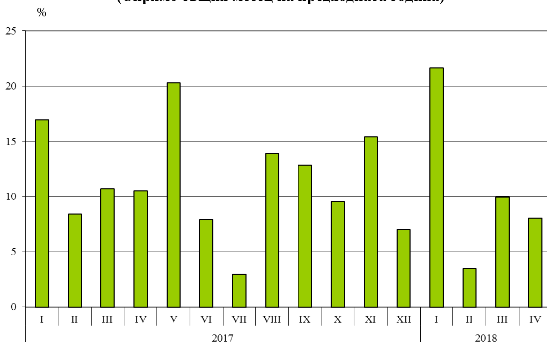
Фиг. 2. Номинално изменение в стойностния обем 1 на вноса на България от ЕС през периода 2017 - 2018 година (Спрямо същия месец на предходната година)

При вноса от ЕС, разпределен според Стандартната външнотърговска класификация , през периода януари - април 2018 г. в сравнение със същия период на 2017 г. най-голямо процентно увеличение е отчетено в сектор „Необработени (сурови) материали, негодни за консумация (изкл. горивата)“ (31.0%), а най-голямо намаление се наблюдава в сектор „Мазнини, масла и восъци от животински и растителен произход“ (12.9%).