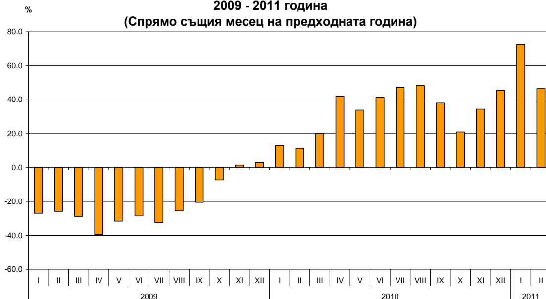
Фиг. 3. Номинален растеж на износа за периода 2009 - 2011 година (Спрямо същия месец на предходната година)

През периода януари - февруари 2011 г. в страната са внесени стоки общо за 6.2 млрд. лв (по цени CIF) , или с 36.3% повече спрямо същия период на предходната година (табл. 1.1 и 1.2).