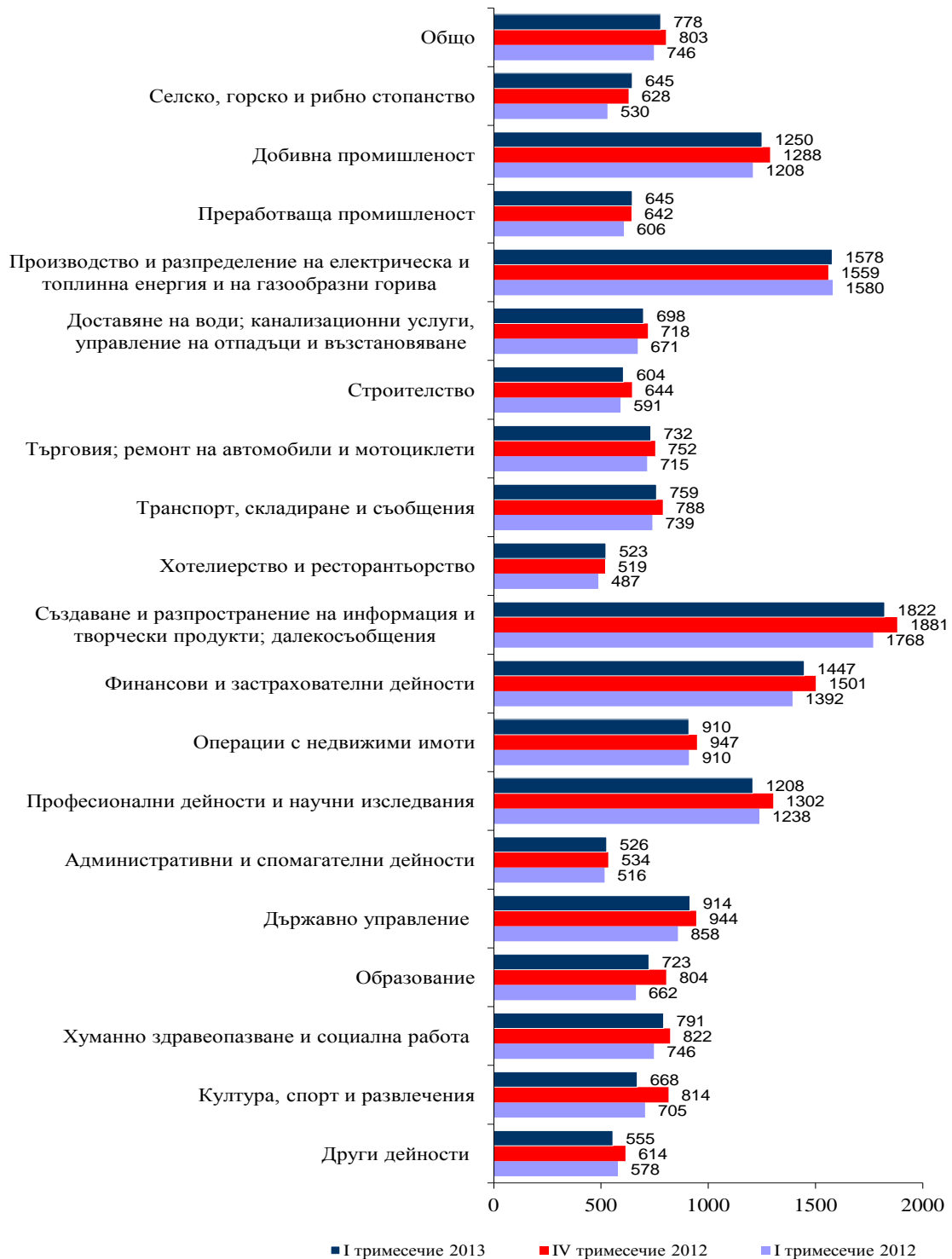
Фиг. 2. Средна месечна работна заплата по икономически дейности (левове)

През първото тримесечие на 2013 г. средната месечна работна заплата намалява спрямо четвъртото тримесечие на 2012 г. с 3.1% до 778 лева. Икономическите дейности, в които е регистрирано най-голямо намаление на средната месечна работна заплата, са: „Култура, спорт и развлечения” - със 17.9%, „Образование” - с 10.1%, и „Професионални дейности и научни изследвания” - със 7.2%.