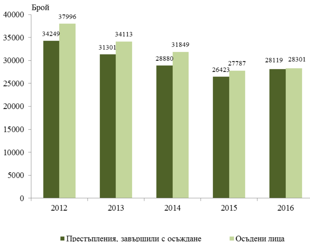
Фиг. 1. Престъпления, завършили с осъждане, и осъдени лица през периода 2012 - 2016 година

Броят на осъдените лица с влезли в сила присъди през 2016 г. е 28 301, като в сравнение с 2015 г. нараства с 1.8%.