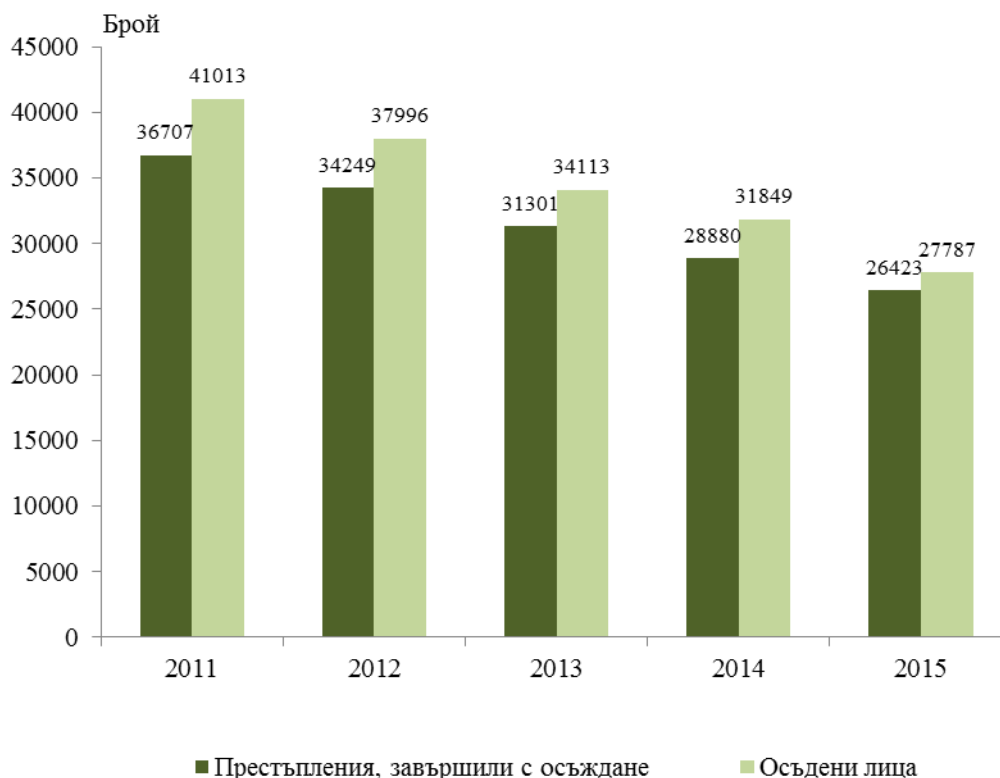
Фиг. 1. Престъпления, завършили с осъждане, и осъдени лица през периода 2011 - 2015 година